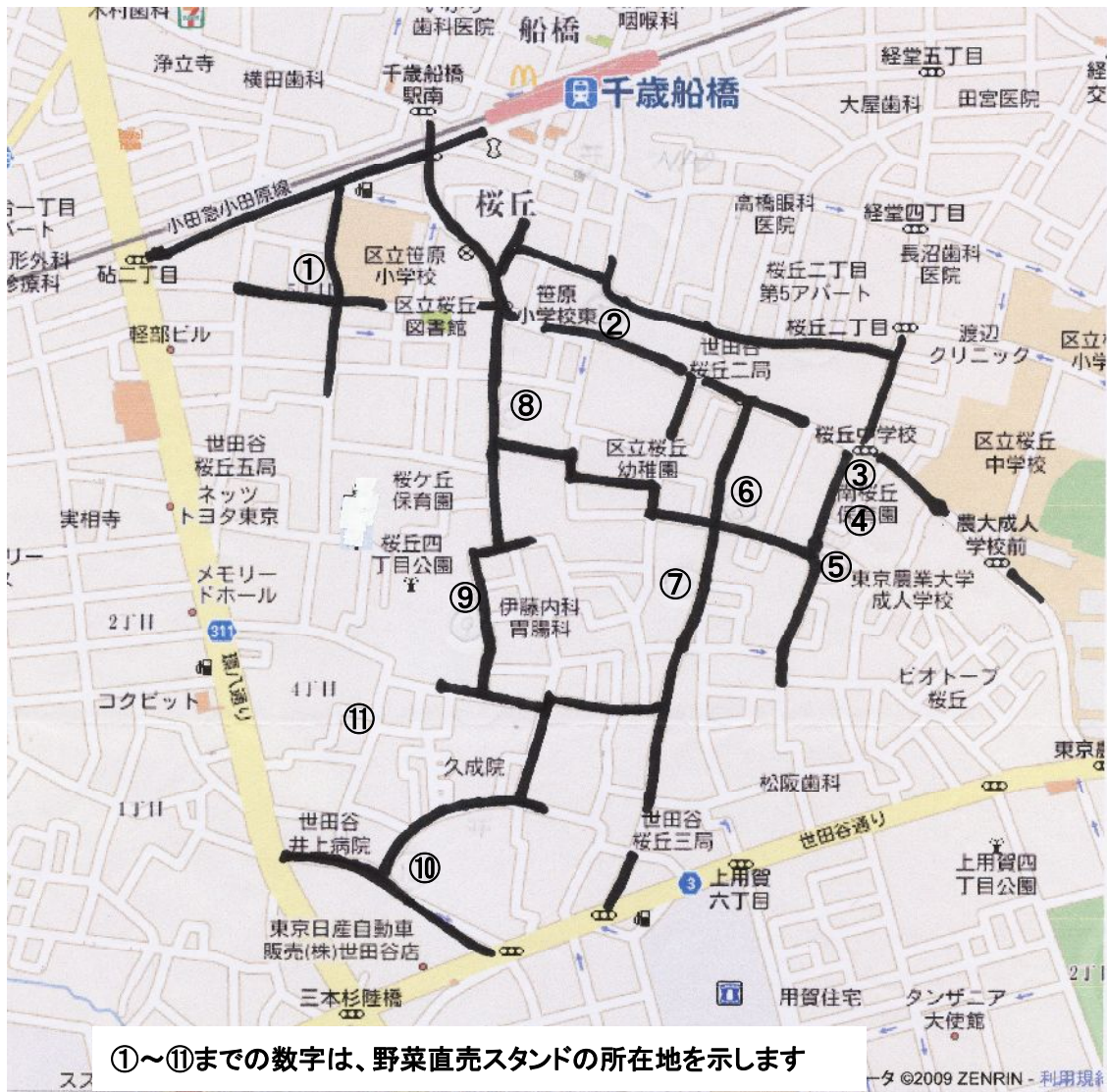
①～⑪までの数字は、野菜直売スタンドの所在地を示します