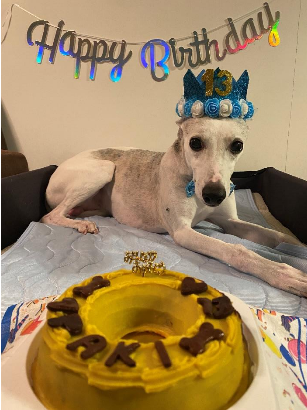
13歳の誕生日の王子